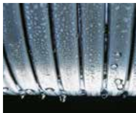
Scambiatore Inox-Radial in acciaio inossidabile

Vitodens 111-W : caldaia a condensazione murale compatta a gas ad elevato comfort sanitario